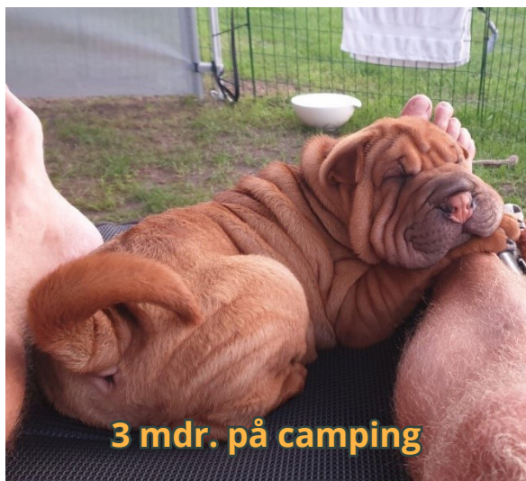
3 mdr. på camping