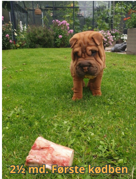
2½ md. Første kødben