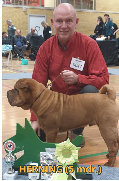
HERNING (5 mdr.)