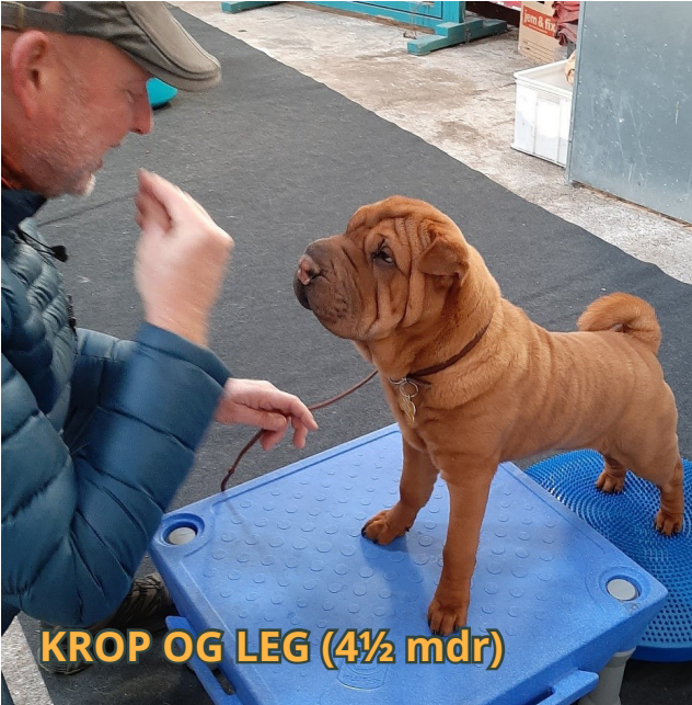
KROP OG LEG (4½ mdr)