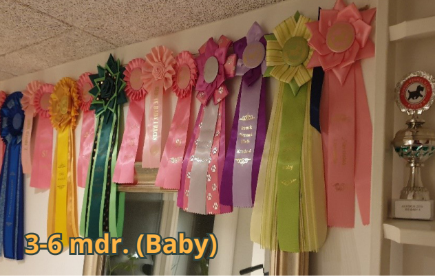
3-6 mdr. (Baby)