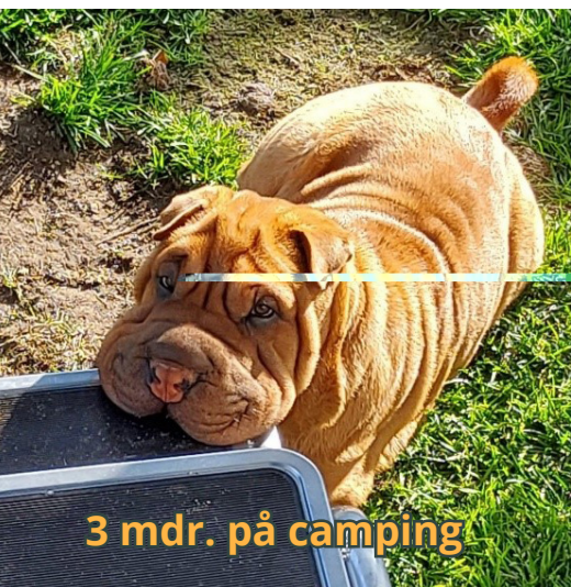
3 mdr. på camping

Kaiser bliver en god 'campinghund', men det er hårdt i en tidlig alder..