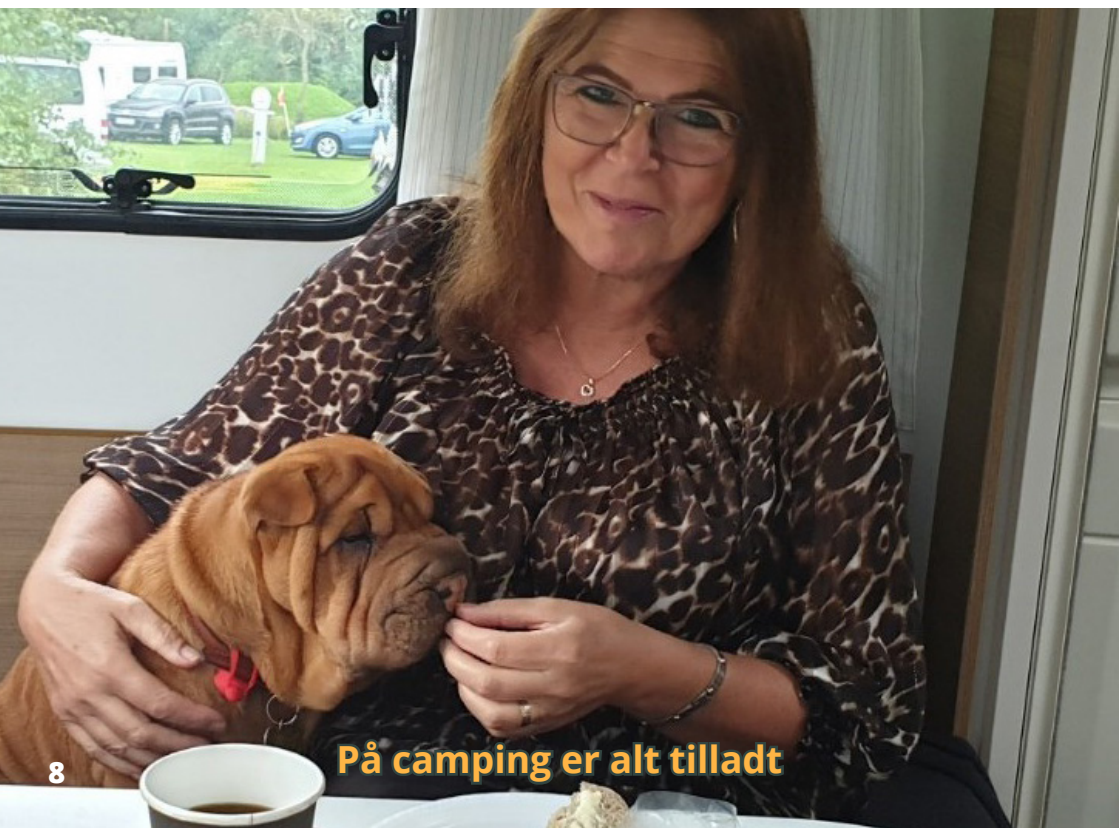
På camping er alt tilladt